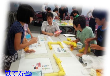
はてな学 「ガスっていったいどこからきたの？ —天然ガスの不思議—」

平成 28 年度 子ども大学しきの 思い出 見て！聞いて！体験して！ たくさん学びました