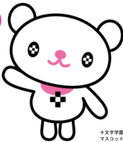
十文字学園女子大学 マスコットキャラクター 「プラスちゃん」