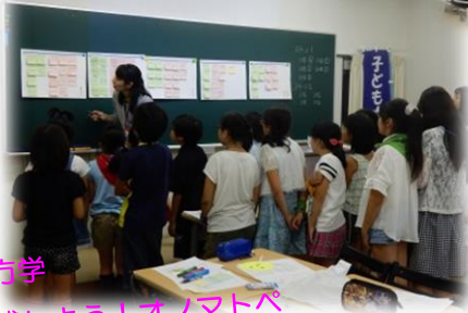
生き方学 「体感しよう！オノマトペ —五感で学ぶ日本語レッスン—」