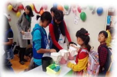
体験会 『ミニあさか』に『しき』の お店を出店しよう！