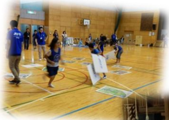
ふるさと学 「日本のこころを学ぼう」

平成 28 年度 子ども大学しきの 思い出 見て！聞いて！体験して！ たくさん学びました